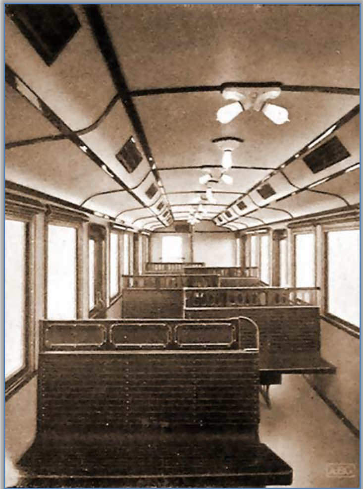
Innenansicht - An der Stirnwand rechts befindet sich der Führerstand

Dieser zweiten Frage ist besonderer Aufmerksamkeit geschenkt und nach eingehender Untersuchung der neuen Wagen so ausgebildet worden, daß das Ein und Aussteigen bei starkem Andrang bequem und in kürzester Zeit als bisher erfolgen kann.