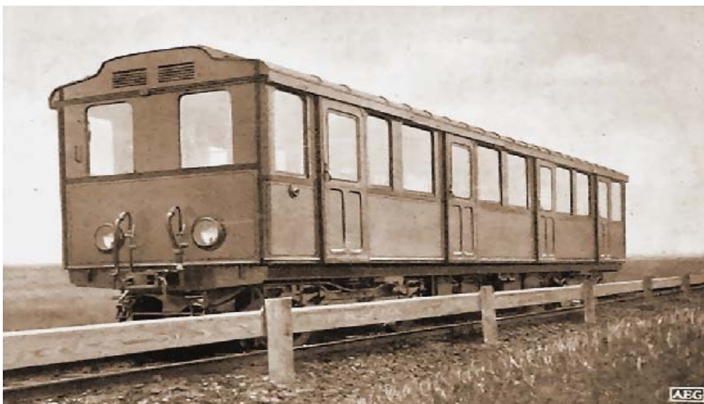
Eiserner Probewagen der AEG-Schnellbahn