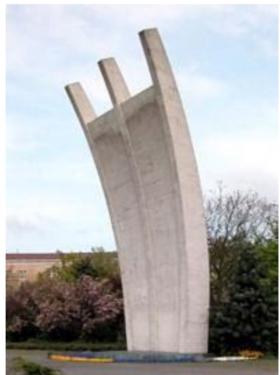
Luftbrückendenkmal in Berlin-Tempelhof

Der Britische Militärgouverneur Sir Brian Robertson kritisierte die Strategie Clays, er hielt die Beibehaltung der Position in Berlin langfristig für zu gefährlich, da die Sowjetunion eine Weststaatsgründung mit der Errichtung eines Staates im Osten mit einer Hauptstadt Berlin beantworten würden. Deshalb schlug er einen alternativen Plan vor, der auf der Analyse beruhte, dass sich die Sowjetunion mit der Blockade Berlins ideologisch diskreditiert hätte und die damit entstandene antikommunistische Stimmung in Deutschland für die Ziele der Westalliierten gewinnbringend genutzt werden könnten. Er sah die minimale Chance, jetzt freie Wahlen in ganz Deutschland abhalten zu können, aus denen die sozialistischen Kräfte als Verlierer hervorgehen müssten.